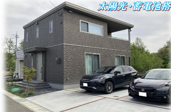
西側前面道路含む現地外観 掲載写真 2023年5月撮影